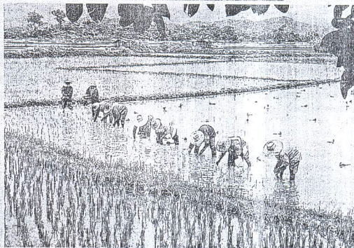
ปรับปรุงบำรุงดินให้สามารถปลูกข้าวและปาล์ม