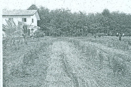
ใช้หญ้าแฝกรักษาความชื้นหน้าดิน

ช่วงดาวเรืองอายุ 21-25 วัน ซึ่งเป็นระยะที่ต้นมีใบจริงขนาดใหญ่ ประมาณ 4 คู่ และส่วนยอดมีใบเล็ก ๆ 1-2 คู่ เกษตรกรจะปลิดยอดทิ้ง