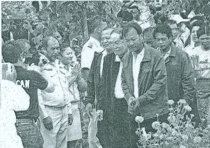
องคมนตรี เยี่ยมชมแปลงปลูกดาวเรือง