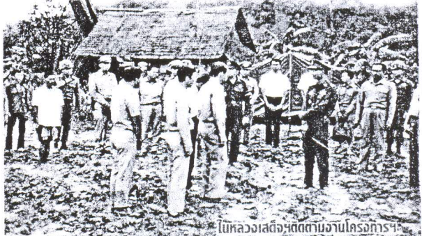
ในหลวงเสด็จติดตามงานโครงการฯ

เข้าไปทำกินและอยู่อาศัยแทนสมาชิกที่ถูกคดีสิทธิ สำหรับกรดำเนินการของโครงการฯ ตั้งแต่ปี 2513 จนถึงปัจจุบันได้ดำเนินการพัฒนาที่ดินในรูปแบบต่าง ๆ เช่น การเปิดป่า ปรับพื้นที่ จัดสร้างถนน ทำระบบอนุรักษ์ดินและน้ำ จัดแบ่งพื้นที่ตามขนาดของแปลงตามที่กำหนด และตามแผนผังของหมู่บ้านสหกรณ์ รวมถึงการรับสมัครและคัดเลือกราษฎรเข้าเป็น