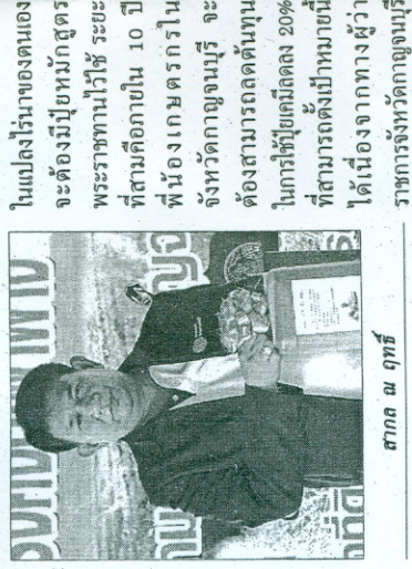
ในแปลงไร่นาของตนเองจะต้องมีปุ๋ยหมักสูตรพระราชทานไว้ใช้ ระยะที่สามคือภายใน 10 ปี ที่นี้เองเกษตรกรในจังหวัดกาญจนบุรี จะต้องสามารถลดต้นทุนในการใช้ปุ๋ยเคมีลดลง 20% ที่สามารถตั้งเป้าหมายนี้ได้เนื่องจากทางผู้ว่าราชการจังหวัดกาญจนบุรี