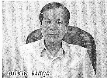
อกิยาค จงสุก

แม้ว่าประเทศไทยจะมีการจัดงานเฉลิมฉลองวันดินโลกมาก่อนหน้านี้แล้ว 2 ปี แต่ในปี 2557 นี้ กรมพัฒนาที่ดิน กระทรวงเกษตรและสหกรณ์ จะจัดงานเฉลิมฉลอง