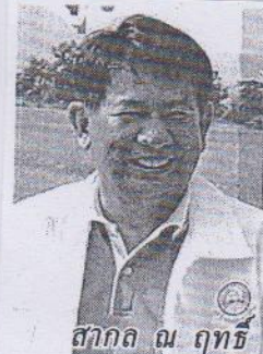
สากล ณ ฤทธิ

กาญจนบุรี สำนักงานพัฒนาที่ดินเขต 10 ร่วมบูรณาการในโครงการ โดยขั้นแรกคือการปรับปรุงสภาพดิน ซึ่งดินในพื้นที่โครงการจะมีสภาพแห้งแล้งเป็นดินทราย ที่สำคัญเมื่อขุดลึกลงไปประมาณ 1.5-2 เมตร จะเจอชั้นดาน อีกทั้งด้วยการเป็นพื้นที่อับฝน ปริมาณน้ำฝนตกน้อย แม้ว่ากรมชลประทานจะได้สร้าง