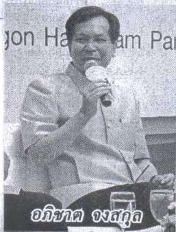
อภิชาติ จงสกล

การจัดงานในครั้งนี้ต้องการให้คนที่มาชมงานได้เห็นพระอัจฉริยภาพในการคิดแก้ไขปัญหาดิน และน้ำอย่างลึกซึ้งมา และบางเรื่องเป็นสิ่งที่นักวิทยาศาสตร์หรือผู้เชี่ยวชาญอาจจะมองข้ามไป แต่พระองค์ทรงมองเห็นจุดเล็กๆ เป็นกลาง เหมือนเส้นผมบัง